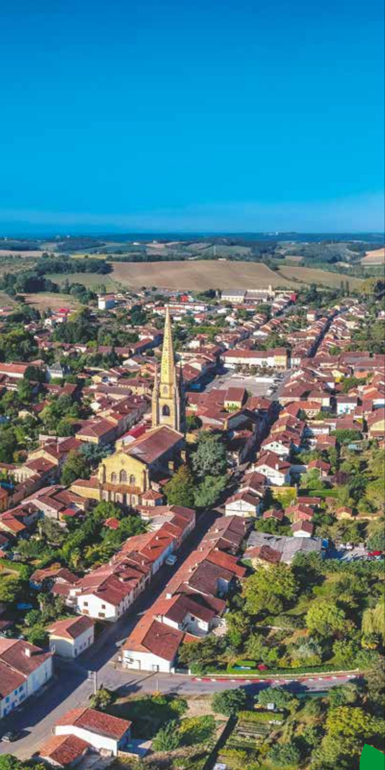
Ville de Marciac.