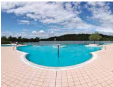
Piscine de Marciac