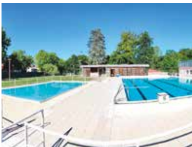
Piscine de Plaisance